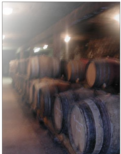
En cave, l'élevage en fût de chêne.

Vignes cultivées en biodynamie Contrôle culture biologique par ECOCERT