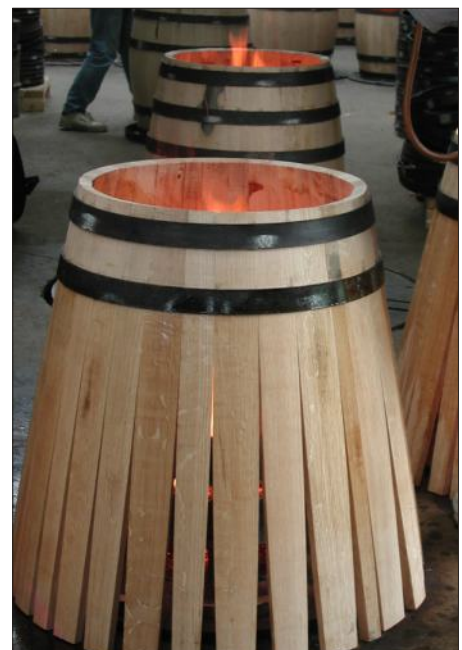
Naissance d'un fût de chêne.

Vignes cultivées en biodynamie Contrôle culture biologique par ECOCERT