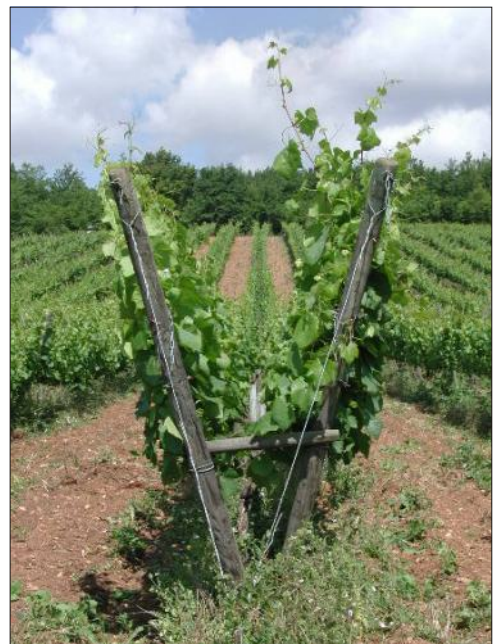
La vigne en lyre, l'ensoleillement idéal.

Vignes cultivées en biodynamie Contrôle culture biologique par ECOCERT